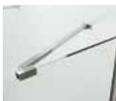
Barre de renfort angulaire

Note : la paroi fixe de 10mm n'est pas fournie avec une barre de renfort. Vendue séparément