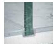
Profilé sol en niche