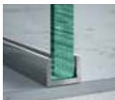
Canal en U