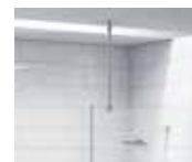
Barre verticale attachée au plafond