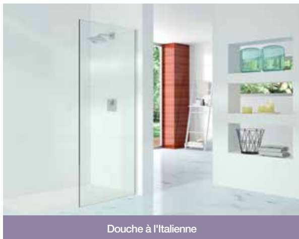
Douche à l'italienne

Veillez noter : la paroi fixe de 8 mm n'a pas de barre de renfort dans les emballages de 300 à 600. Vendu séparément. A partir de la taille 700, la barre de renfort est inclus