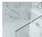
Barre de renfort droite