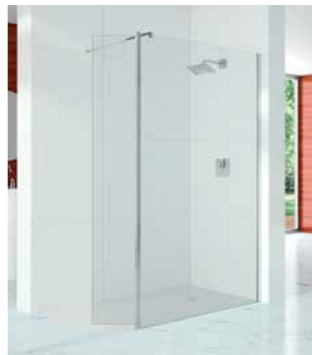
Douche à l'italienne / avec Paroi Pivotante