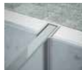
Profilé mural en niche