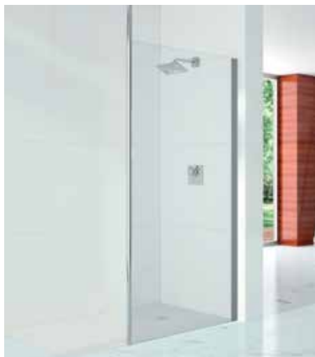
Douche à l'italienne / avec Mât Vertical