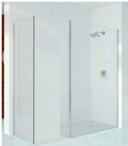
Douche à l'italienne / avec Paroi Cube